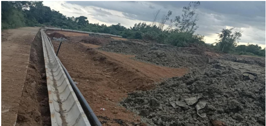
农沟施工中（U形槽安装）