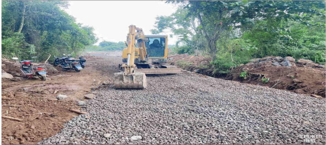
生产路施工中（级配碎石垫层碾压）