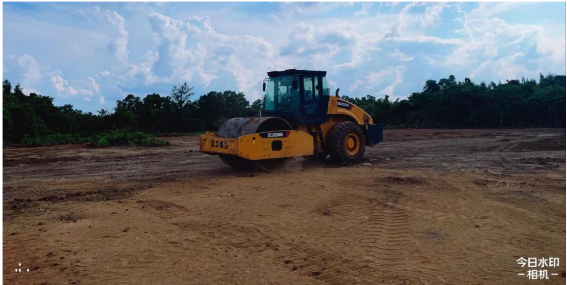
3号地块施工中（犁底层碾压）