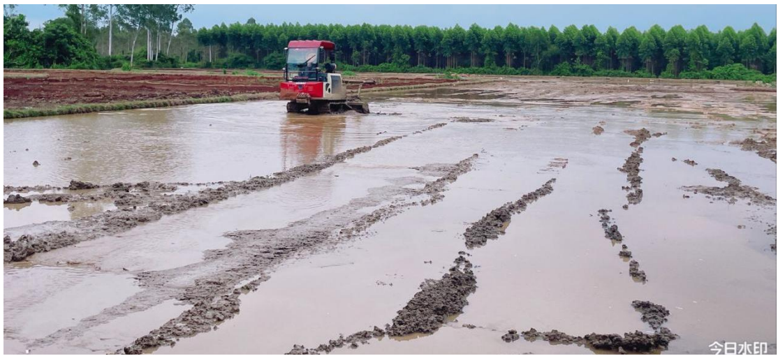
3号地块施工中（旋耕）