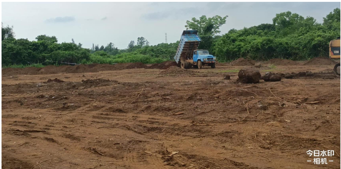
2号地块施工中（客土回填）