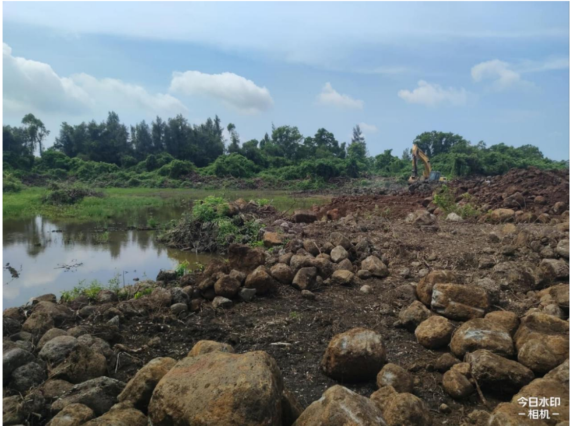
2号地块施工中（土地平整）