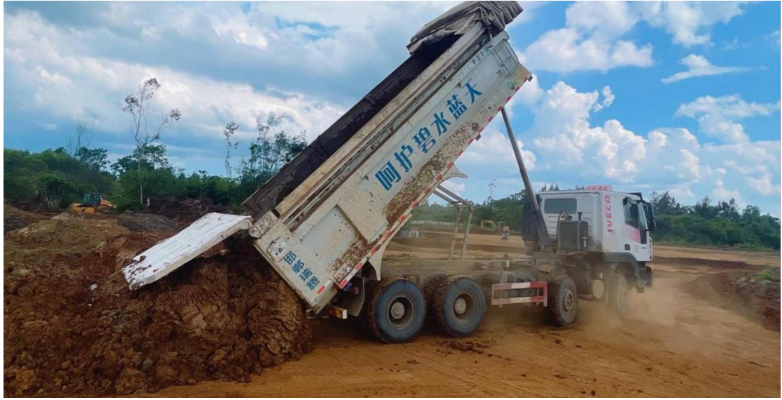
土地平整施工中（外购黏土构建犁底层）