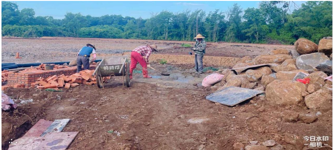
项目标志牌施工中