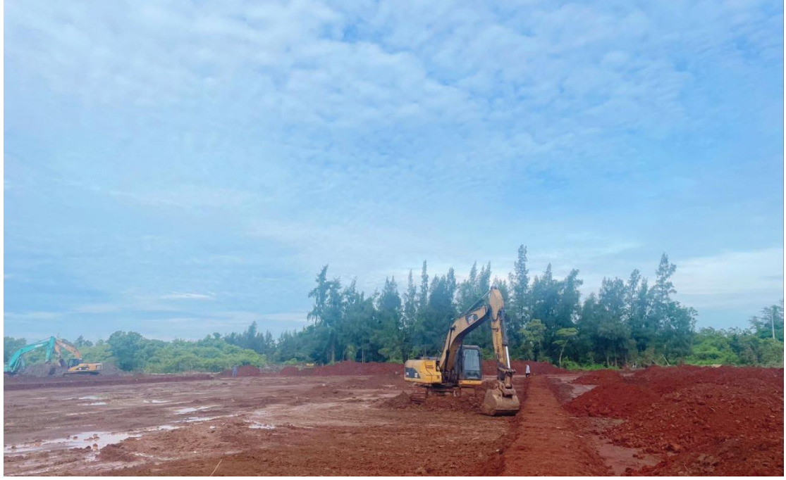
1号地块施工中（客土回填）