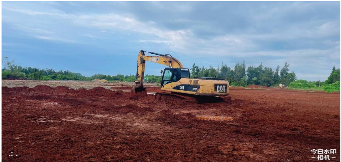
3号地块施工中（表土回填）