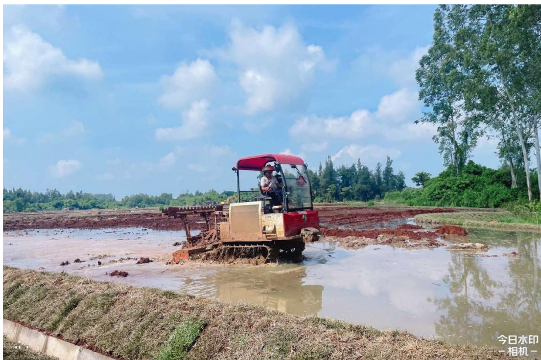
1号地块施工中（旋耕）