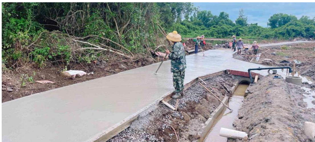
下田坡道施工中（混凝土浇筑）