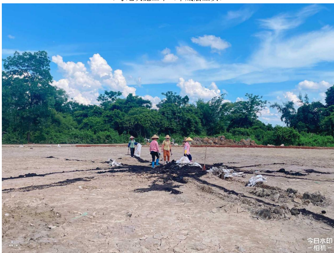
4号地块施工中（土壤改良）