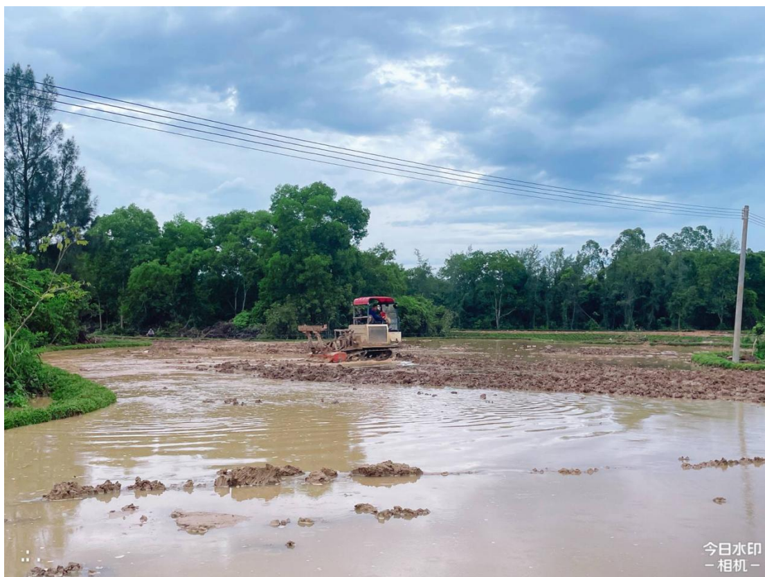
4号地块施工中（旋耕）