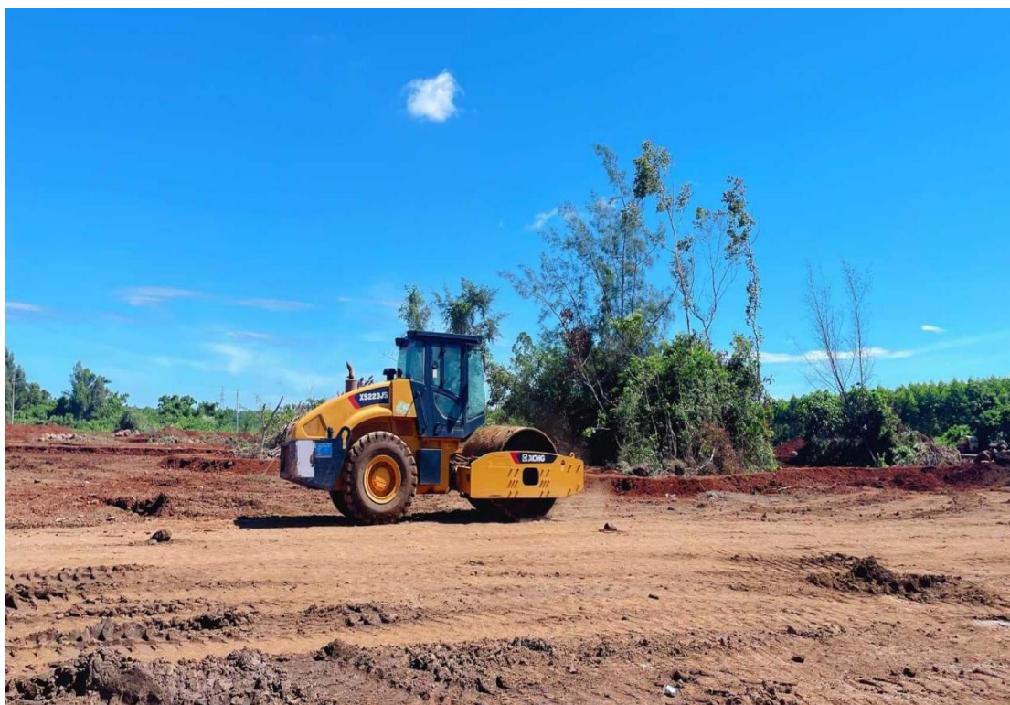
1号地块施工中（犁底层碾压）