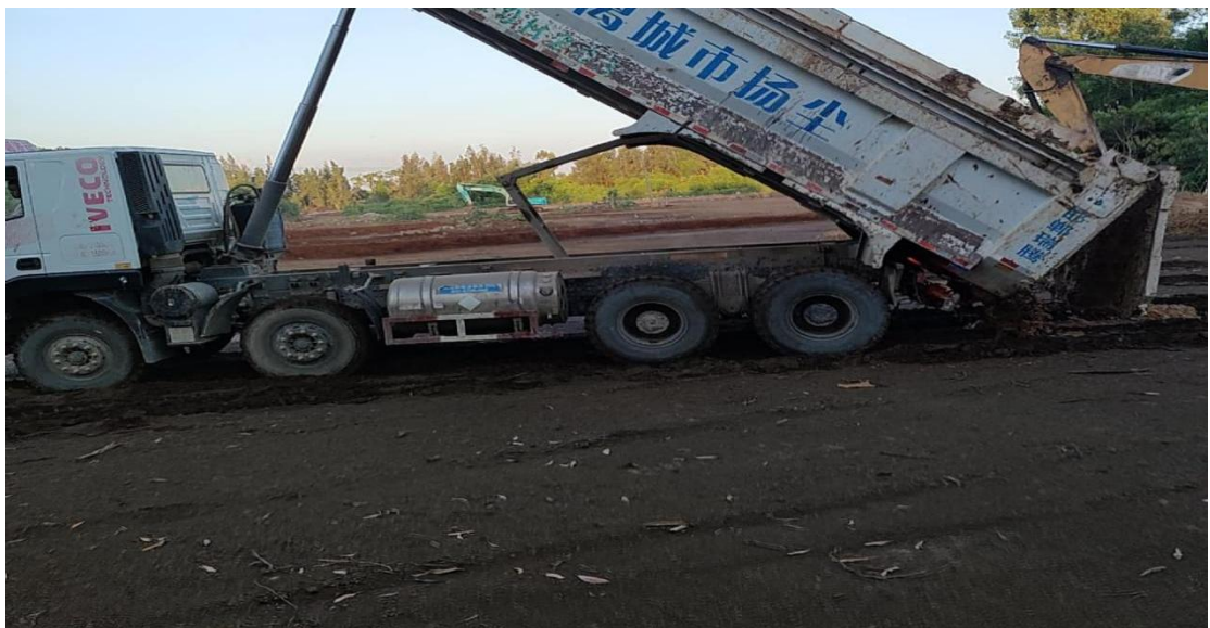
2号地块施工中（土壤改良）