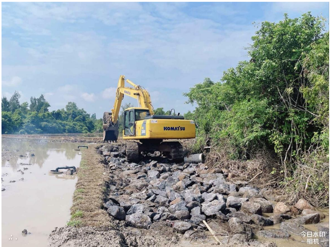
生产路施工中（路基填筑）