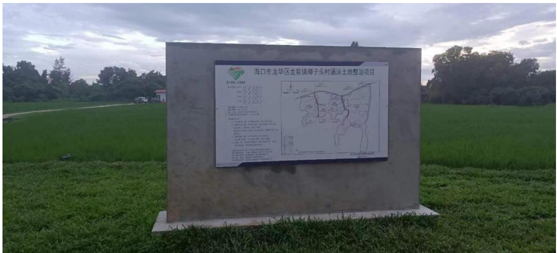
项目标志牌施工后