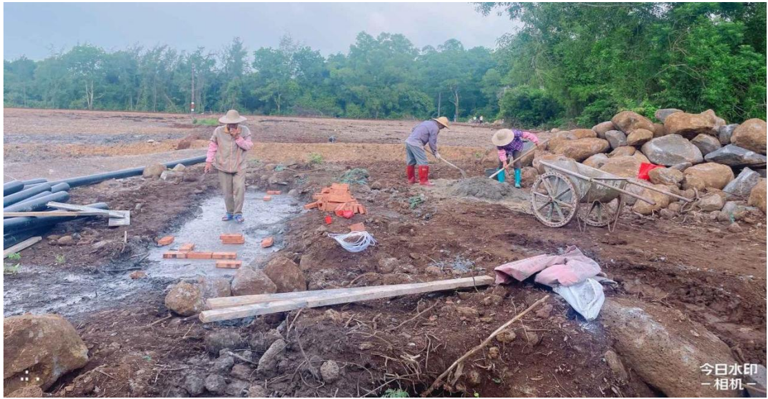
项目标志牌施工前