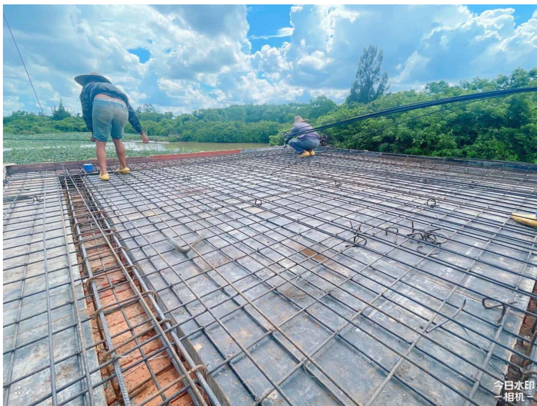
泵房施工中（屋面板钢筋制安）