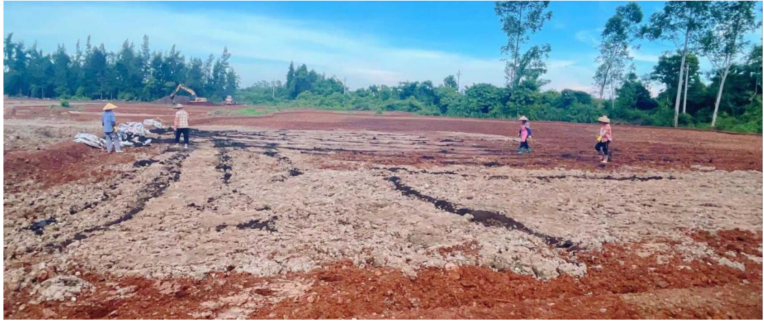
3号地块施工中（土壤改良）