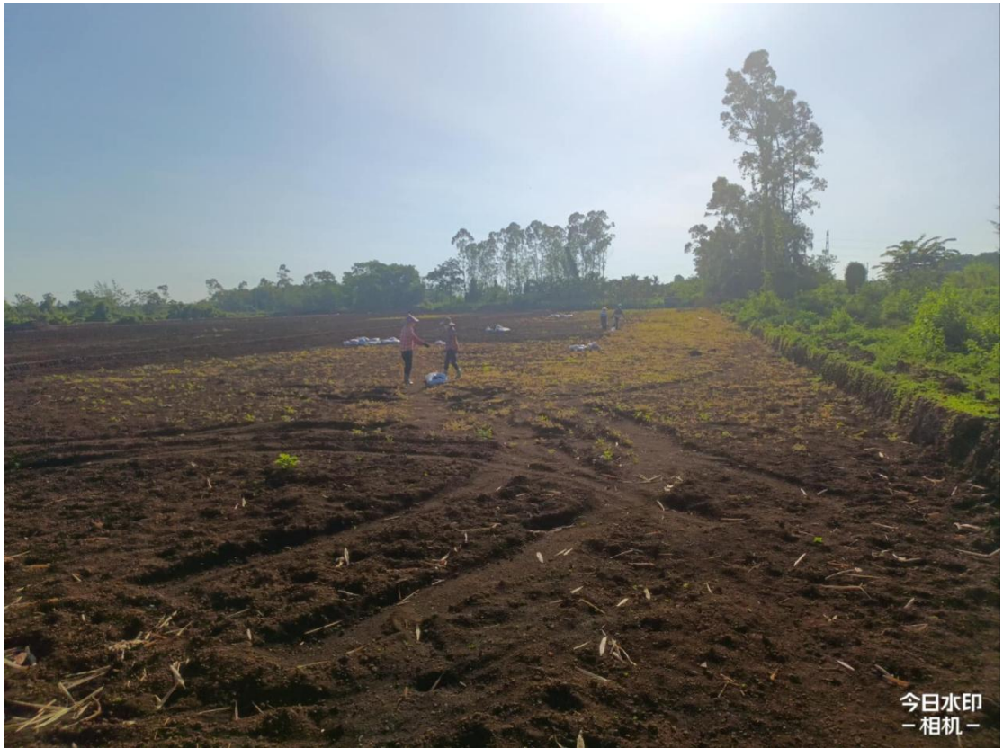
1号地块施工中（土壤改良）