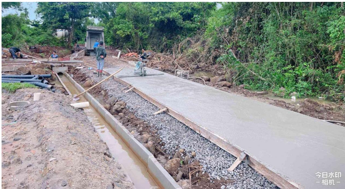
生产路施工中（路面浇筑）