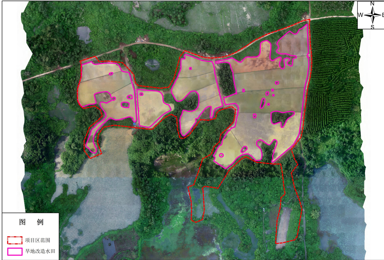
海口市龙华区龙泉镇椰子头村涵泳土地整治项目遥感影像图（竣工后）