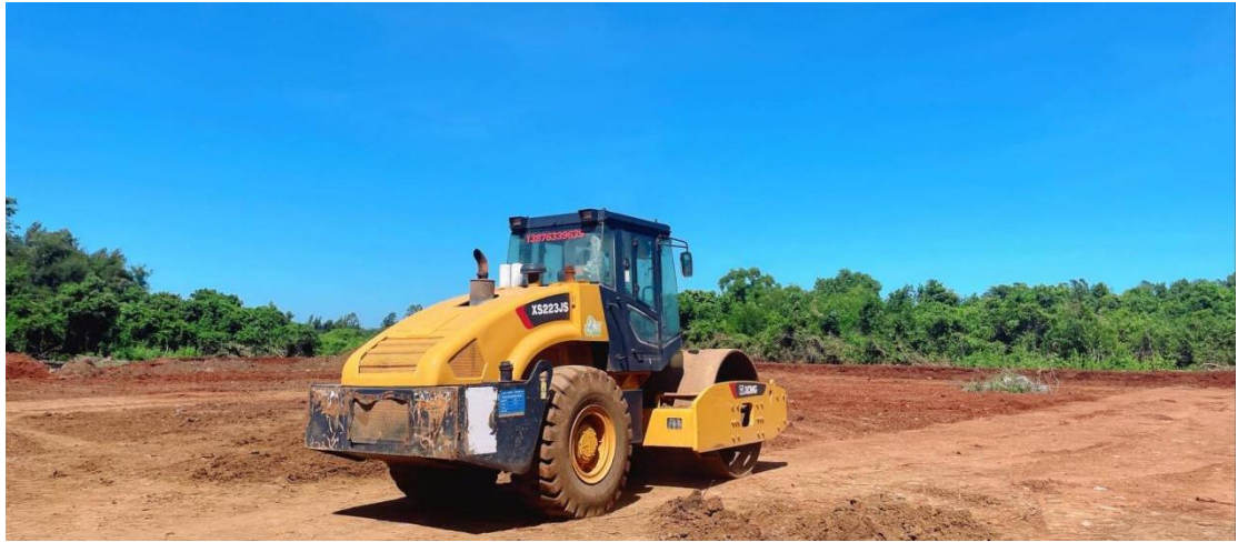
2号地块施工中（土壤压实）