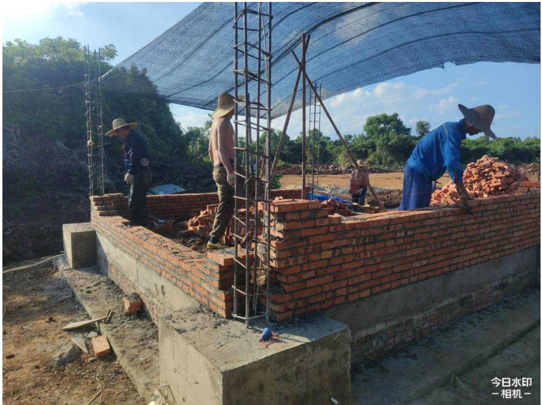
泵房施工中（墙体砌筑）