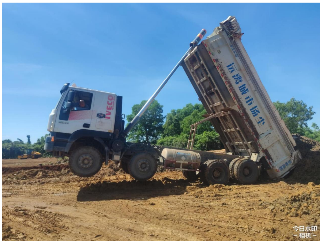
1号地块施工中（外购黏土构建犁底层）