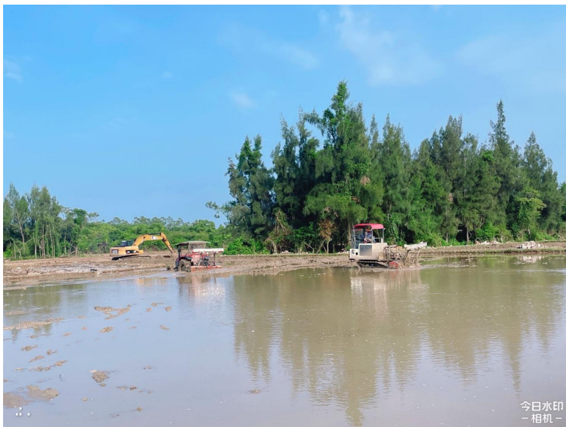
2号地块施工中（旋耕）