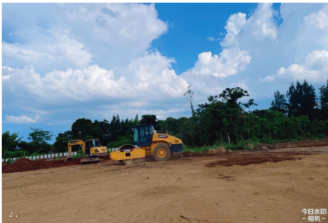
4号地块施工中（犁底层压实）