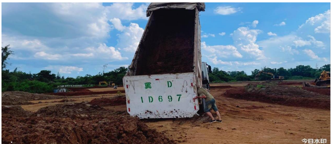
4号地块施工中（外购黏土构建犁底层）