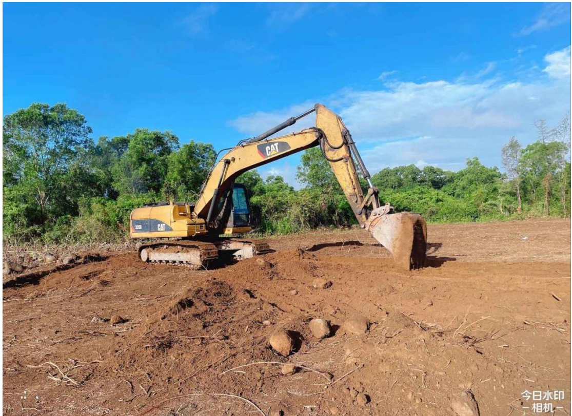
1号地块施工中（土地平整）