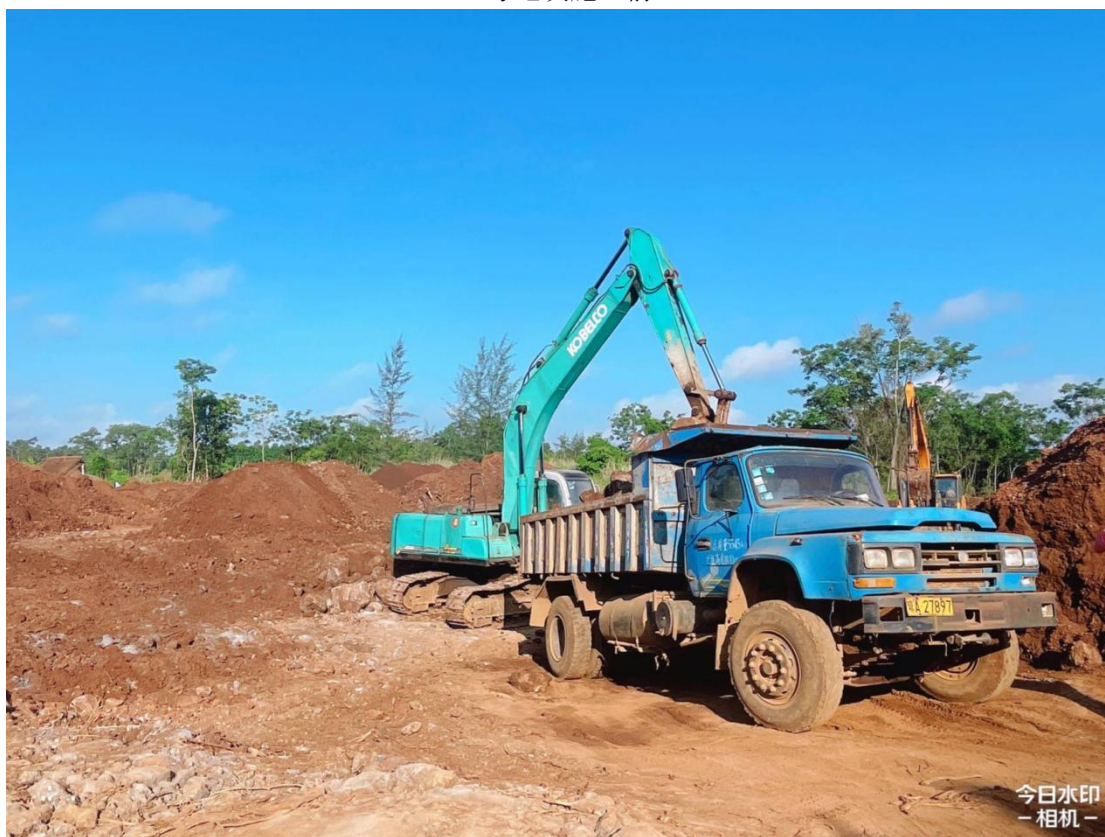
3号地块施工中（土地平整、石方清理）