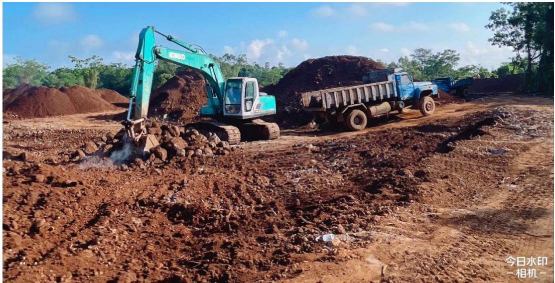
4号地块施工中（土地平整、石方清理）